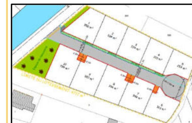
Légende des installations projetées