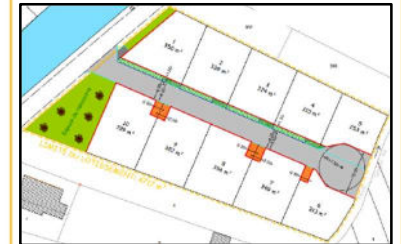
Légende des installations projetées